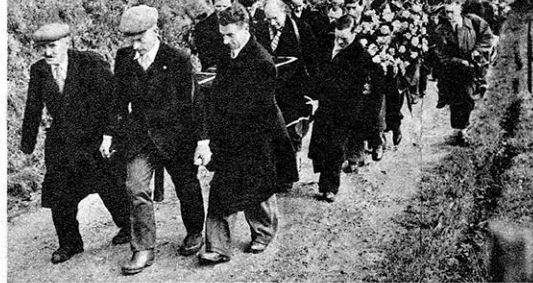
In seinem Heimatort Cuverville in der Normandie wurde André Gide zur letzten Ruhe geleitet.

das Gelispel brennender Männer und Frauen, die, wie ich wußte, daß der protestantisch getaufte Gide dem christlichen Glauben keinen Wahrheitsgehalt zubilligen vermochte, für den Gedächtnis mit besonderer Inbrunst beteten. Viele weinten still. Ein bekannter Dominikanerprediger der Gides Einfluß auf die Jugend tief bekämpft hatte, trat ein, verbeugte sich tief vor dem Toten, sah ihn lange an und verneigte sich noch einmal, die er ging. Einmal sah ich zwei Nonnen, Lehrschwester einer höheren Schule, auf den Knien beten, und neben ihm stand der achtzigjährige Paul Léautaud, unter den Schriftstellern der erklärte Feind von Kéroul, der aber ein Christum inspirierten Kunst. Es waren zwei durch einen Abgrund getrennte Welten, die sich eins fühlen in der Verneigung für Gide. Auch das, was die Generationen scheiden, war hier aufgehoben. Zwischen Ministern, Diplomaten, hohen Beamten und den Greisen der „Académie Française“ sah man Offiziere, Soldaten und Studenten. Leute, die Gide nicht persönlich gekannt hatten, waren eigens aus der Provinz, aus Belgien und der Schweiz gekommen, wie es das aufgelegte Re-